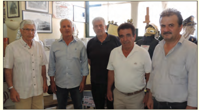
Με τον Πρόεδρο και μέλη του Δ.Σ. του Συλλόγου Συνταξιούχων Πυροσβεστών ν. Καρδίτσας

καλό θα βγει για τους συναδέλφους. Στους δύσκολους καιρούς, που ζούμε, δεν χωράνε εγωισμοί και υπεροψίες. Για να κατορθώσουμε να περιστώσουμε κάτι από αυτά που με πολύχρονους αγώνες αποκτήσαμε και που, μέρα με τη μέρα, χάνουμε, ένας δρόμος υπάρχει. Αυτός του κοινού αγώνα. Εάν σ' αυτό προσθέσουμε και την επιτακτική ανάγκη για στήριξη των μελών μας που, όπως σχεδόν το σύνολο του ελληνικού λαού, βιώνουν κι αυτά, τα οδυνηρά αποτελέσματα της οικο-