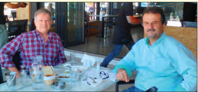
Με τον Πρόεδρο της Ένωσης Αποστράτων Π.Σ. ν. Λάρισας

νομικής κρίσης, τότε ο δρόμος αυτός γίνεται μονόδρομος και δεν επιτρέπεται να μένουμε αδιάφοροι.