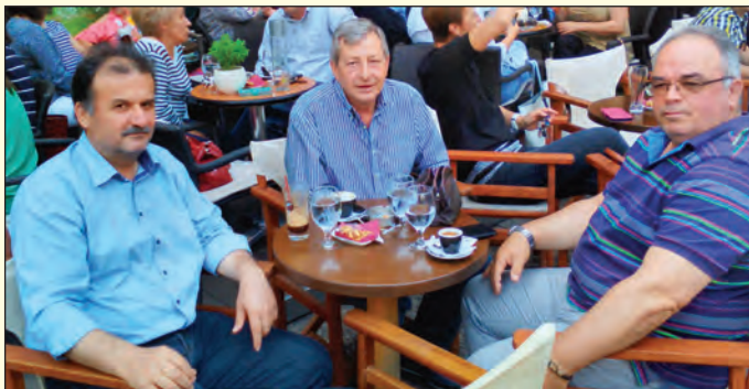
Με τον Αντιπρόεδρο και τον Γραμματέα του Συλλόγου Αποστράτων Πυροσβεστών ν. Τρικάλων