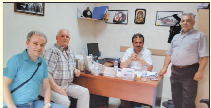
Με τον πρόεδρο και μέλη του Δ.Σ. του Συλλόγου Αποστράτων Π.Σ. ν. Κιλκίς