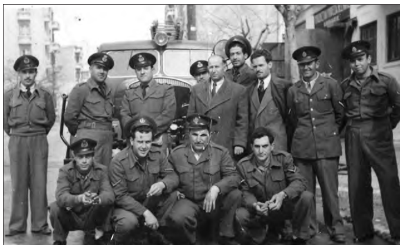
Με μία παρέα συναδέλφων μπροστά στον Α' Πυροσβεστικό Σταθμό Θεσσαλονίκης όταν αυτός στεγαζόταν στη γωνία των (σημερινών) οδών, Αλεξάνδρου Σβώλου & Δημητρίου Γούναρη.

Μεταξύ των εικονιζόμενων, διακρίνονται οι αείμνηστοι συναδέλφοι: