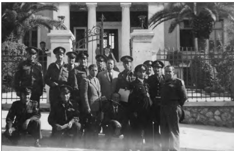
Μία ομάδα υποψηφίων αξιωματικών, αμέσως μετά τη διαδικασία των εξετάσεων, τη δεκαετία του 1940.