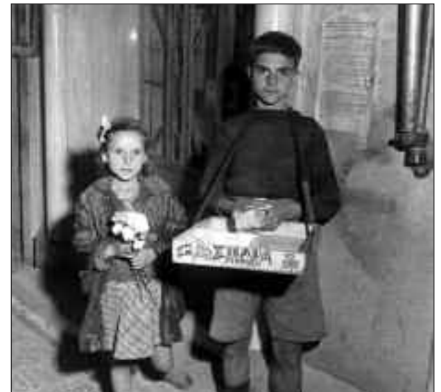
1944. Λιανεμπόριο τσιγάρων

Μια άλλη παράμετρος της θέσης ενός εργαζόμενου στη θέση του συνταξιούχου είναι το ...παραμύθι του "ελεύθερου χρόνου" αφού λογικά εξαλείφεται το ωράριο εργασίας. Ο συνταξιούχος είναι παντός καιρού. Η φύλαξη των εγγονιών λόγω εργασίας των παιδιών του έχει γίνει αποκλειστική φροντίδα, αφού η κρατική πρόνοια απουσιάζει και τα κριτήρια βρεφονηπιακού και σχολικού περιβάλλοντος όχι μόνο φύλαξης αλλὰ και δημιουργικής απασχόλησης, όπου υπάρχουν, είναι δυσπρόσιτα. Η εξυπηρέτηση στην αγορά των προϊόντων διαβίωσης και της πληρωμής των όποιων υποχρεώσεων είναι καθημερινότητα. Ουσιαστικά οι περισσότεροι συνταξιούχοι αναλαμβάνουν να "μπαλάνουν" τα όλο και